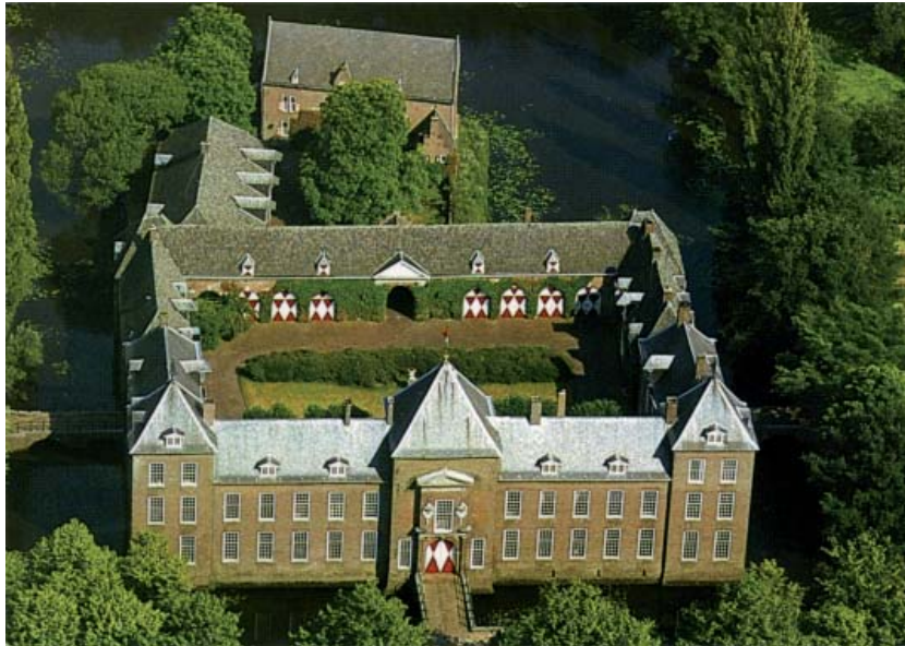
Kasteel Heeze, Heeze (Noord-Brabant).

den we met eigen ogen de bijzondere badkamer uit 1795 met een bad in Romeinse stijl aanschouwen. Enkel van ons konden de verleiding niet weerstaan en hebben ook daadwerkelijk een bad genomen. Na deze uitgebreide rondleidingen hebben we op het tweede binnenplein het glas geheven op een zeer geslaagde middag.