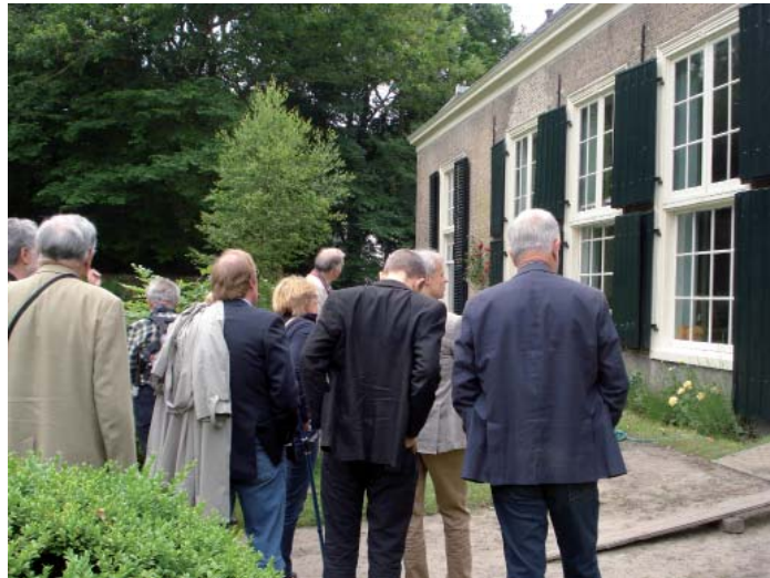
Buitenplaats Berbice, Voorschoten (Zuid-Holland).