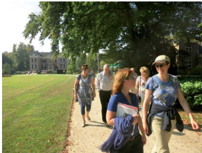
Bestuur, medewerkers en vrijwilligers bij huis Doorn (Utrecht).

Opnieuw nam het aantal donateurs licht af, ondanks 18 nieuwe aanmeldingen. We sloten het jaar af met 684 donateurs en 120 donateurs voor het leven.