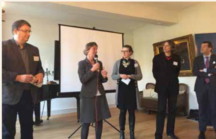
Stuudiemiddag in Limburg. Ondervraging van het panel