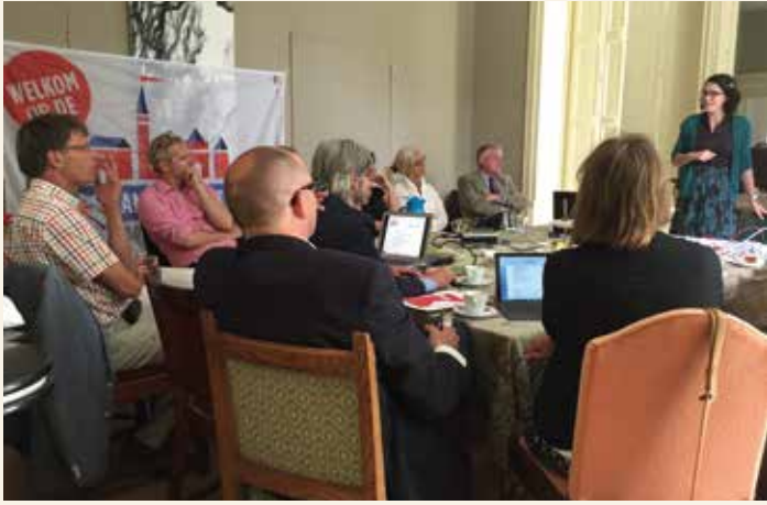
Deelnemersbijeenkomst Overijssel van de Dag van het Kasteel