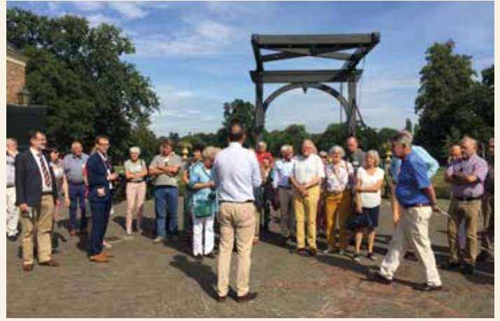
Donateursexcursie Kasteel Twickel