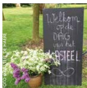
DAG VAN HET KASTEEL