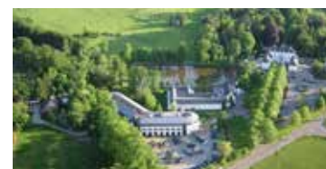
VAALS BROEK VANUIT DE LUCHT.