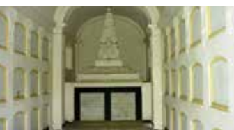
HET MAUSOLEUM VAN BINNEN.