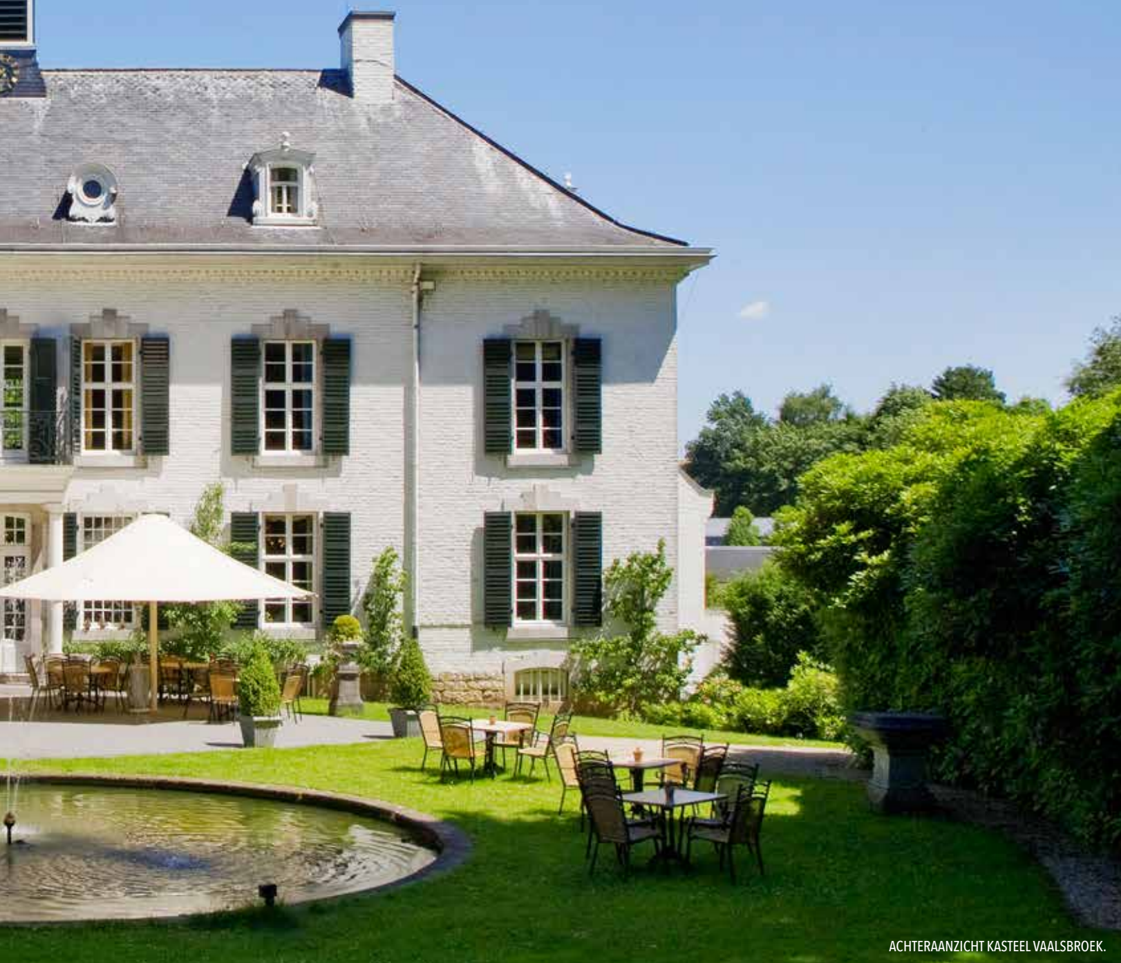
ACHTERAANZICHT KASTEEL VAALSBROEK.