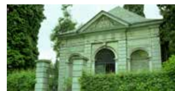
HET MAUSOLEUM VAN DE FAMILIE VON CLERMONT.