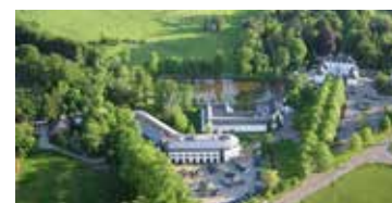
VAALSBROEK VANUIT DE LUCHT.