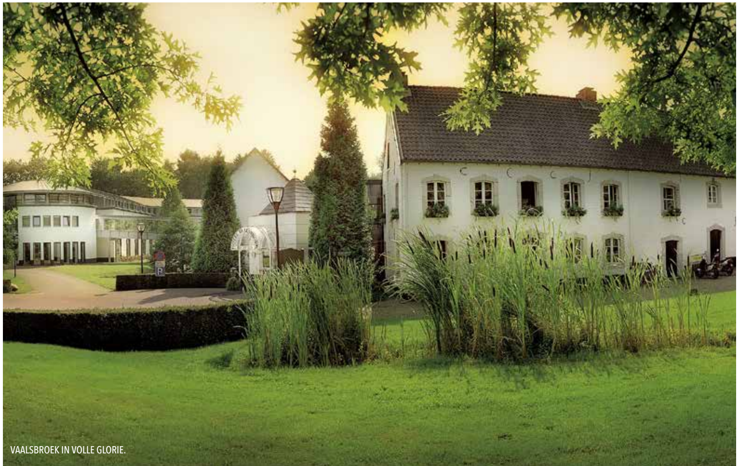
VAALSBROEK IN VOLLE GLORIE.