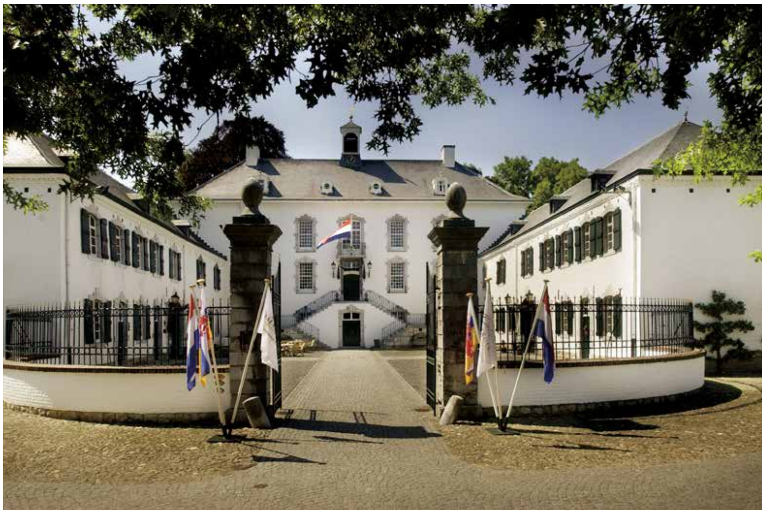
HET KASTEEL AAN DE VOORZIJDE MET HET BINNENPLEIN EN DE TWEE VLEUGELS.

De moderne tijd kwam plotseling voor het dorpje Vaals. In de 16e eeuw bestond het uit niet veel meer dan een handvol boerderijen met bijbehorende schuren. Het meest opvallende gebouw was een kopermolen, waar koper tot grote platen werd geslagen.