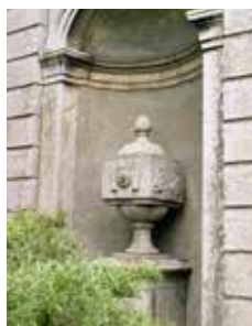
DETAIL VAN HET MAUSOLEUM (FOTO PETER VAN DER WIELEN).