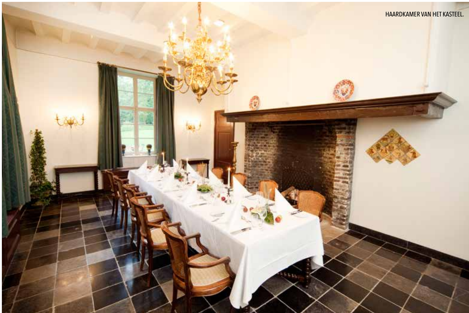
HAARDKAMER VAN HET KASTEEL.