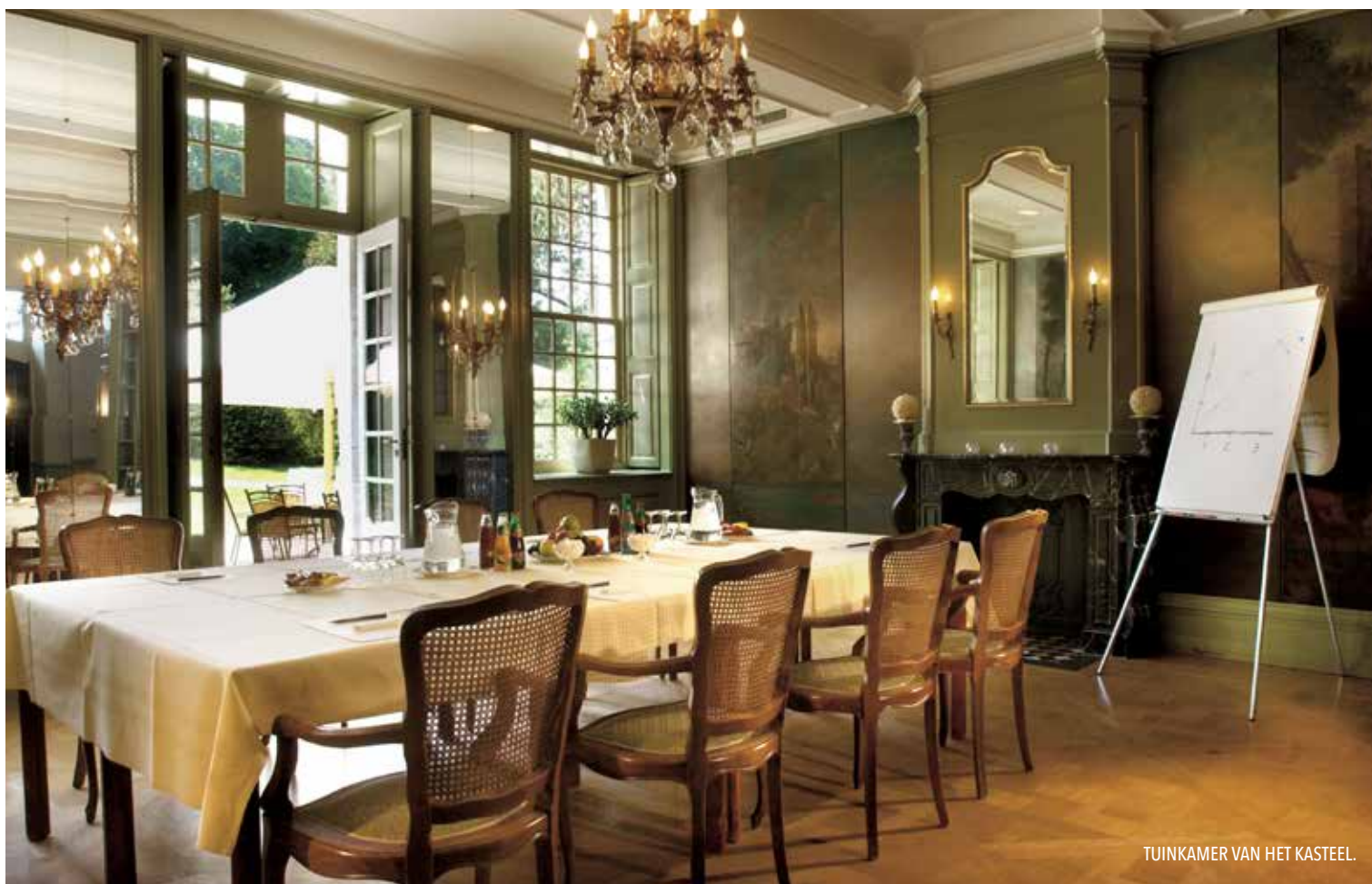
TUINKAMER VAN HET KASTEEL.