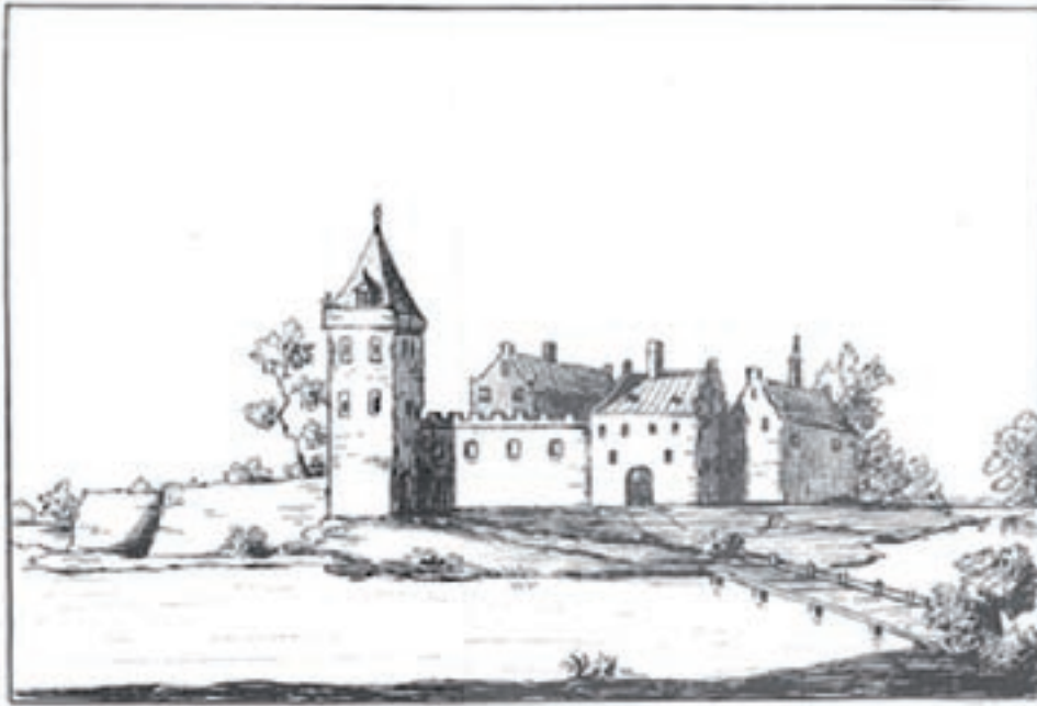
Een fantasietekening van Stoutenburg uit 1720.

het archeologisch erfgoed. Het rapport van adviesbureau ABT bevat helaas nog te veel onduidelijkheden over de belasting en de daardoor optredende vervorming van de ondergrond. Deze vervorming kan een bedreiging vormen voor de archeologische resten. Bovendien geeft het rapport duidelijk aan dat er funderingspalen door de oude resten heen aangebracht zullen worden. Vervolgens heeft de Sectie Archeologie van de gemeente Amersfoort duidelijk aangegeven in haar commentaar op de plannen geen voorstander te zijn van bebouwing van het kasteelterrein.