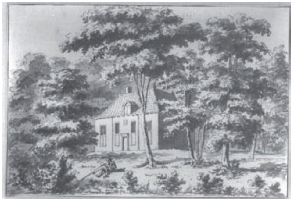
Het landhuis Stoutenburg in 1730, getekend door L.P. Serrurier.

Er is meer dan genoeg ruimte om de bouwplannen elders op het landgoed te verwezenlijken.