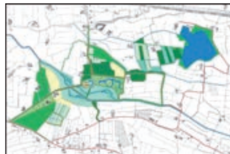
Het herstelplan Stoutenburg.

Voor de architectuur wordt bewust gekozen voor een eigentijds ontwerp, omdat dit past